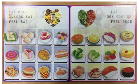
ภาพที่ 2 เกมสักระดานอาหารควรเลือก/อาหารควรหลีกเลี่ยง

เป็นเกมที่มีตัวติดรูปภาพ จำนวน 24 ชิ้น แบ่งเป็น อาหารควรเลือก 12 ชิ้น และอาหารควรหลีกเลี่ยง 12 ชิ้น โดยให้ผู้เล่นเลือกวางตัวติดรูปภาพตามกลุ่มที่ถูกต้อง