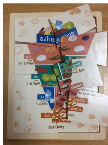
ภาพที่ 1 เกมสัจจิกซองโภชนาการ

เป็นเกมที่ให้ต่อจิกซองตามรูปธงโภชนาการที่กำหนด หลังจากนั้นให้อธิบายความหมายของภาพ โดยผู้สอนสามารถสอดแทรกความรู้จากการเล่นได้ โดยเน้นย้ำหมวดหมู่อาหารและปริมาณอาหารที่ควรรับประทานต่อวัน