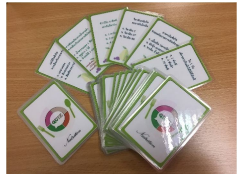
ภาพที่ 4 เกมสัไพ่ทายคำถามอาหารสุขภาพ

คำถามการนับคาร์บ 20 ใบ โดยให้ผู้เล่นตอบคำถามตามไพ่ที่เลือกให้ถูกต้อง