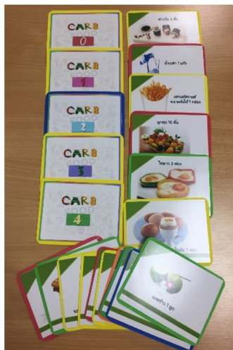
ภาพที่ 3 เกมสัภาพนับคาร์บ

เป็นเกมสัเลือกจับคู่ภาพอาหาร 18 ภาพกับจำนวนคาร์บที่กำหนดให้